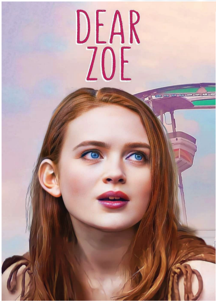
Querida Zoe (2022)

Veja como fazer no site: jornaldafronteira.com.br