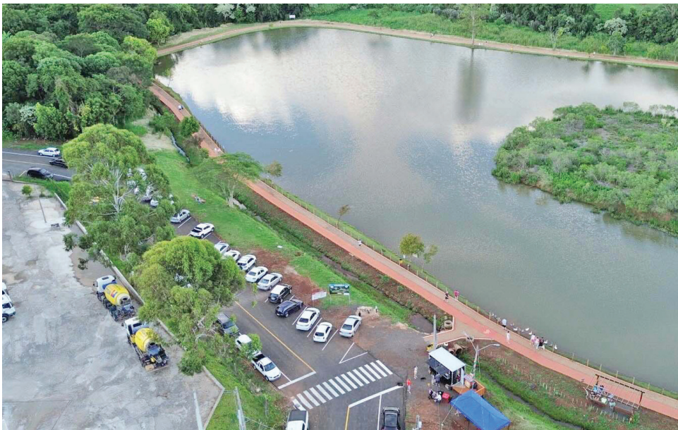
as condições de acesso diário e contribui para o planejamento urbano integrado, beneficiando desde caminhoneiros até moradores que utilizam a região para serviços e comércio.

ao Lago Municipal, revitalizadas em paralelo, integram o conjunto de obras que conectam lazer e trabalho, promovendo uma circulação mais eficiente para toda a comunidade. De acordo com a Administração Municipal, essas ações formam um pacote amplo de qualificação urbana, essencial para organizar o espaço produtivo do Parque Dr. Neme e estimular o crescimento econômico em São José do Cedro. A conclusão da sinalização viária fortalece a atratividade do parque para investidores, melhora