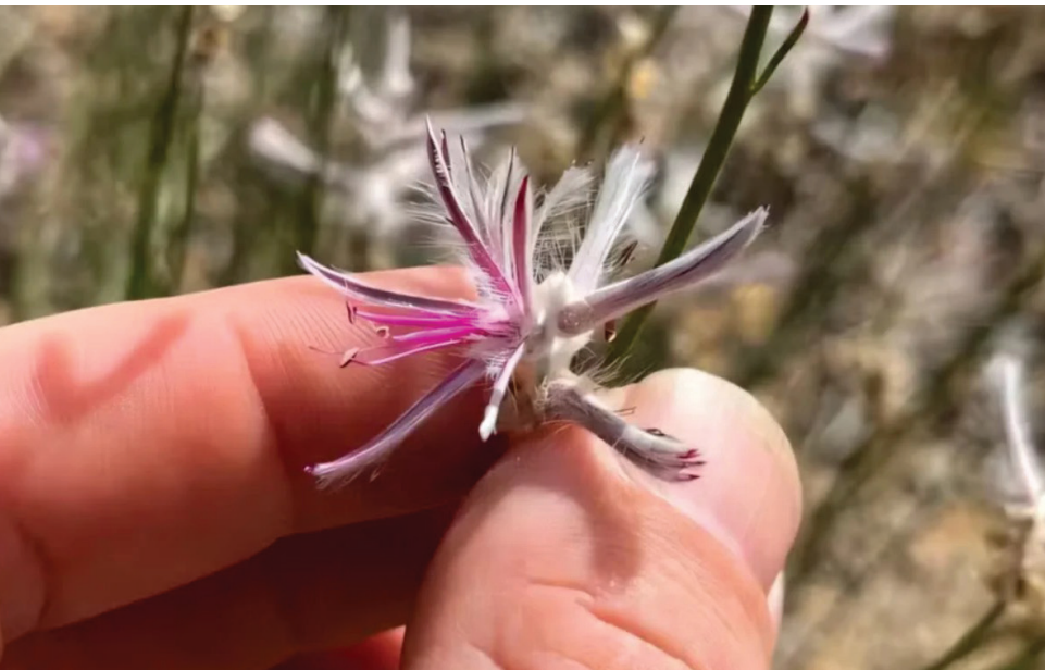
Uma planta considerada extinta há cerca de 60 anos foi redescoberta no norte da Austrália, reacendendo o debate sobre o papel

Registro casual feito por um horticultor em uma fazenda no norte da Austrália levou à redescoberta de uma planta considerada extinta desde os anos 60