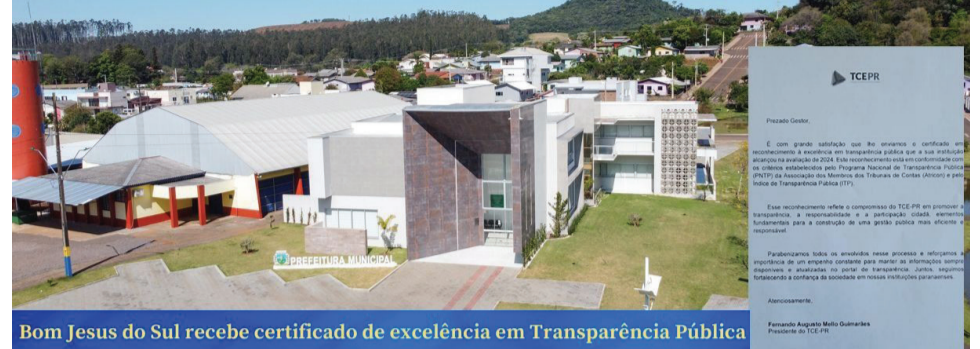
Bom Jesus do Sul recebe certificado de excelência em Transparência Pública

A certificação do PNTTP avalia diversos aspectos, como a qualidade