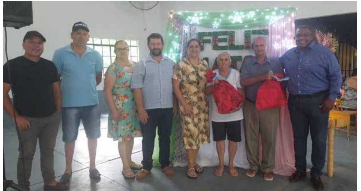
Social e Agentes de Saúde.