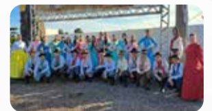
Grupo de Danças CTG Sinuêlo da Fronteira