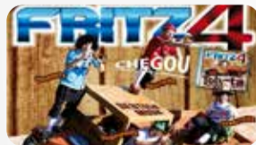
Banda Fritz 4