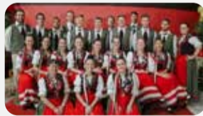
Grupo Ítalo G. Danzatori Del Zauber