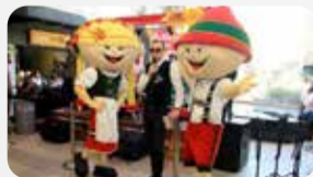
Bonecos Fritz e Frida