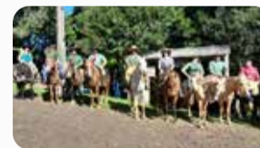
Grupo de Danças Os Ginetes