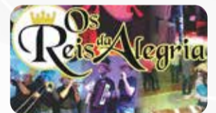
Banda os Reis da Alegria