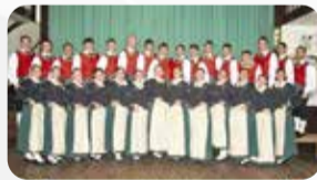
Grupo de Danças TCD Kolping