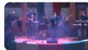
Grupo Sole Mio