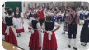
Grupo Dança Cultural A. Planalto