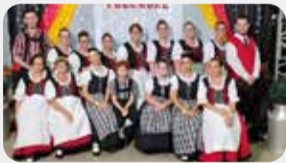
Associação C. Alemã Pinhalzinho