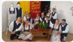
Grupo de Danças Alemã Fest Und Tans