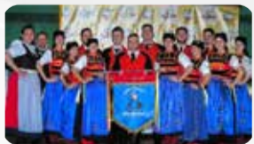
Grupo Volkstanzgruppe Wunderbar