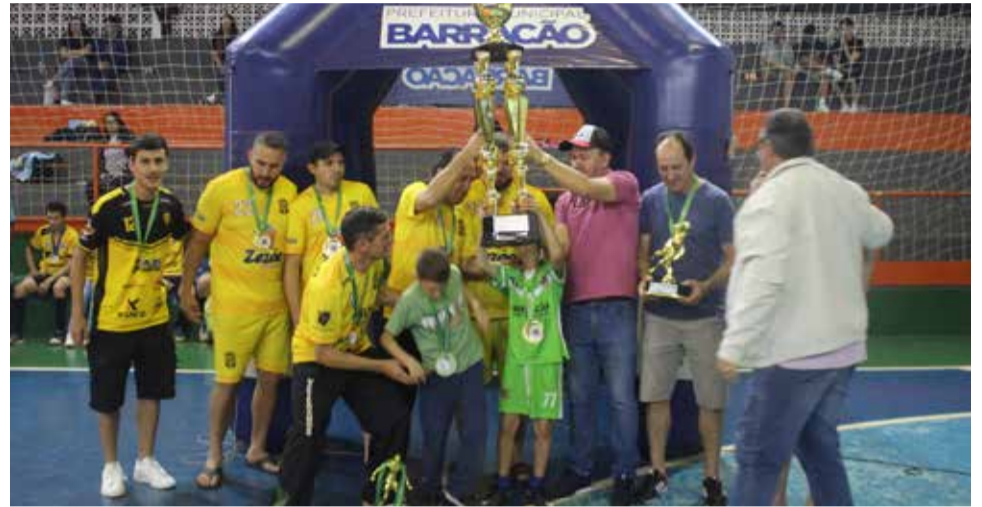
Veterano: Nacional Simoneto