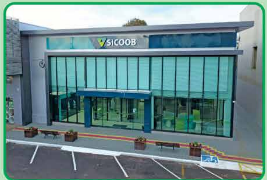
Imagem externa da nova agência em Barracão