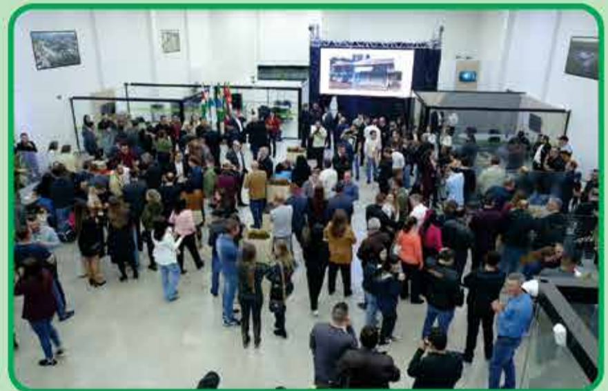
Imagem panorâmica do evento de inauguração

Com isto, os associados confraternizaram com o coquetel e bebidas oferecidos pela cooperativa de crédito Sicoob Vale Sul.